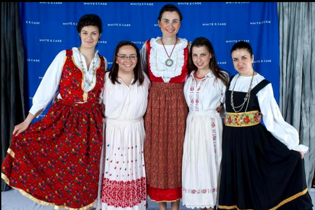
Hrvatski tim na Go National bal-u

Najzanimljiviji društveni događaj je nedvojbeno bio Go National bal . Radi se o večeri u kojoj svaki tim predstavlja svoju državu u narodnim nošnjama. Naš tim je ostao zamijećen po crvenim i bijelim bojama nošnji iz pet različitih krajeva Hrvatske: Posavine, Zagorja, otoka Murtera i Korčule te Dubrovnika. Osim lijepih kostima, studentice su predstavile svoju zemlju i prigodnim turističkim DVD-ovima te svojim kolegama iz svih krajeva svijeta pričale o ljepotama Hrvatske.