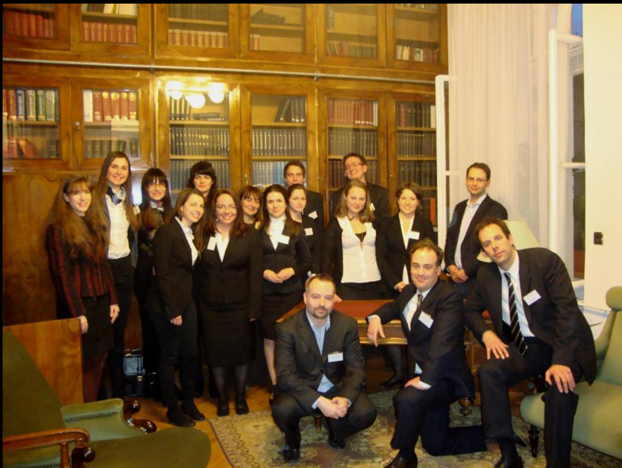
Hrvatski i mađarski Jessup tim

Tim zagrebačkog Pravnog fakulteta odnio je pobjedu u obje runde i to u prvoj rundi s glasovima sudačkog vijeća 2:1, a u drugoj rundi 3:0.