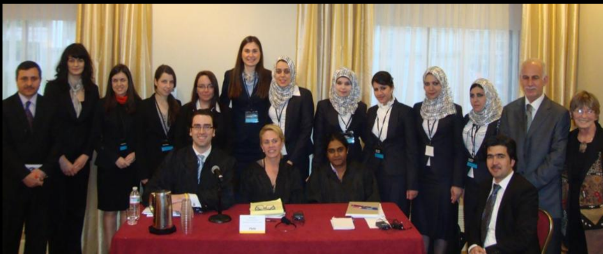
S kolegama iz Iraka, Sveučilište u Bagdadu

U rundama protiv timova iz Iraka i Indonezije, tim zagrebačkog fakulteta je izborio pobjede protiv oba tima uz rezultat od maksimalnih 9:0 bodova [6:0 u usmenom i 3:0 u pismenom dijelu] u pojedinoj rundi. Manje sreće smo imali u rundama protiv Izraela i Ujedinjenog Kraljevstva. Za prolazak u Jessup Advanced Rounds [u koje ulazi 32 tima] nam je nedostajala još jedna pobjeda od koje nas je dijelilo 6 bodova za koliko je bolji bio tim iz Hebrew University of Jerusalem [bodovi u usmenim rundam: 545:539].