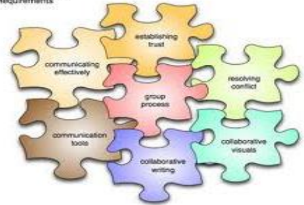
Online Group Work Requirements